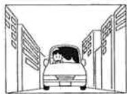
高層ビルなどの間